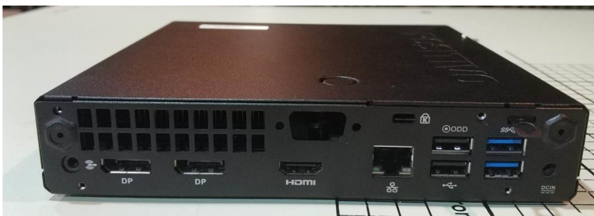
Figura 2 - Vista posterior

Não válido como certificado de conformidade.