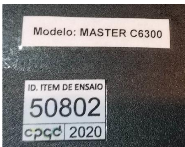
Figura 5 - Identificação

Não válido como certificado de conformidade.