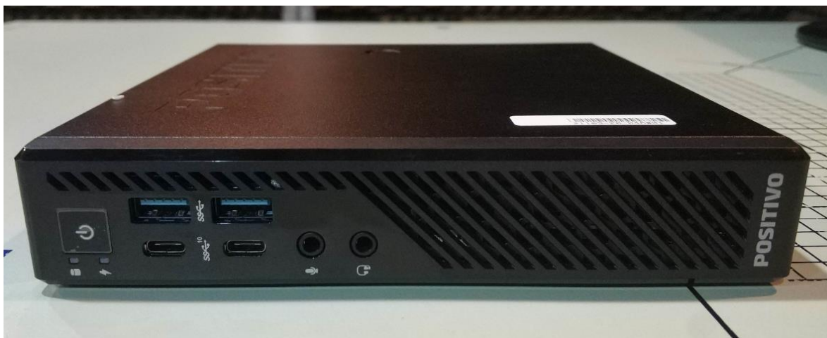
Figura 1 - Vista frontal