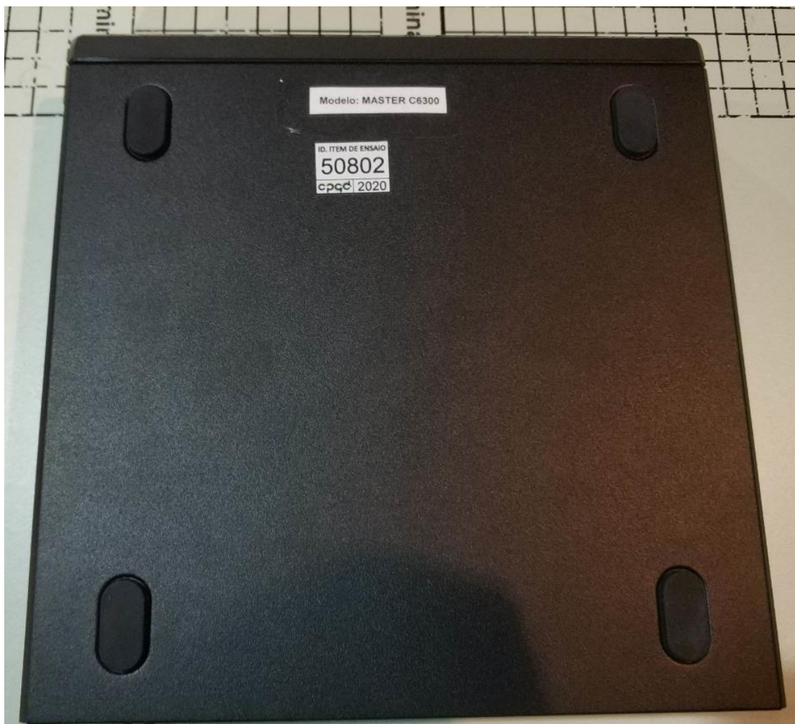
Figura 4 - Vista inferior